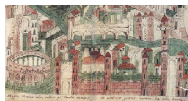
Camera Civile di Verona